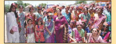
સામૈયામાં સામેલ નિયાણી બહેનો