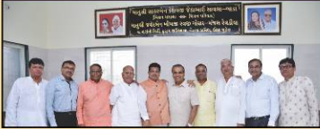
ભોજનાલય ઉદ્ઘાટન લાભાર્થી સાથે