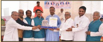
ટ્રસ્ટીઓ દ્વારા અધિકારીઓનું બહુમાન