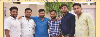
મહોત્સવના કાર્યકરોમાંના સભ્યો