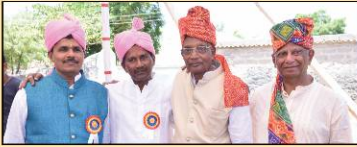
ધ્વજના લાભાર્થી કલ્યાણજીભાઈને આવકાર