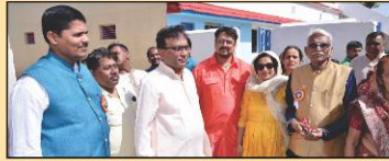
'પ્રેમધન' સંકુલ લાભાર્થી પરિવાર