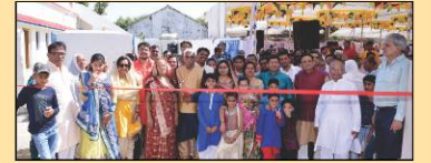
'પ્રેમધન' સંકુલના લાભાર્થી પરિવાર