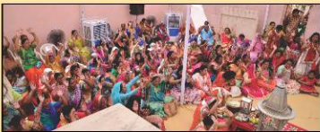
અઢાર અભિષેકમાં તહીન સન્મારીઓ