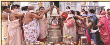
ધ્વજના લાભાર્થી ધ્વજ દંડ ચડાવતાં