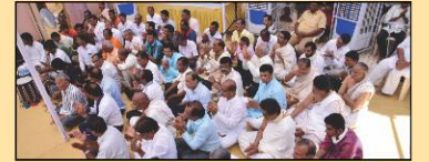
અઢાર અભિષેકમાં મગ્ન સફરનો