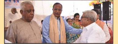
સંકુલ ઉદ્ઘાટન ખુશાલીસહ મે. ટ્રેસ્ટી તથા પ્રમુખશ્રી