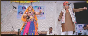
રંગલા-રંગલી દ્વારા ગામની ઐતિહાસિક ઝાંખી