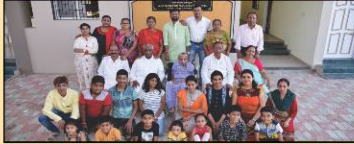
'જલધારા' લાભાર્થી પરિવારજનો