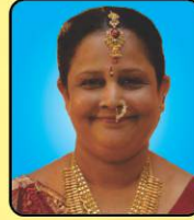
૪ વર્ષીતપ આરાધક સુશ્રાવિકા