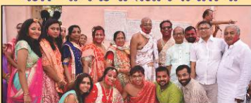
ધ્વજ લહેરાવ્યા બાદ ખુશખુશાલ પરિવારજનો