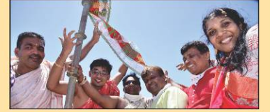
દાદાના શિખરે ૧૩૬મી ધ્વજ લાભાર્થી પરિવારો