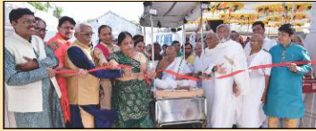
અતિથીઓ દ્વારા સંકુલ ઉદ્ઘાટન