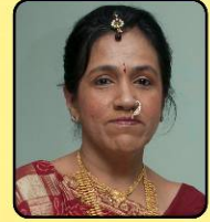
પ્રેમાળ ધર્માનુરાગી સુશ્રાવિકા