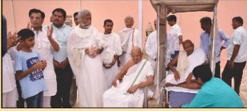
ગચ્છાધિપતિશ્રીનો નગર પ્રવેશ